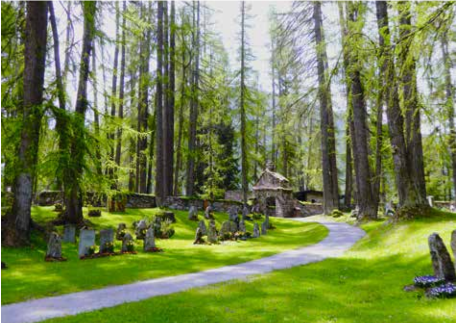
Frühling im Waldfriedhof Wildboden