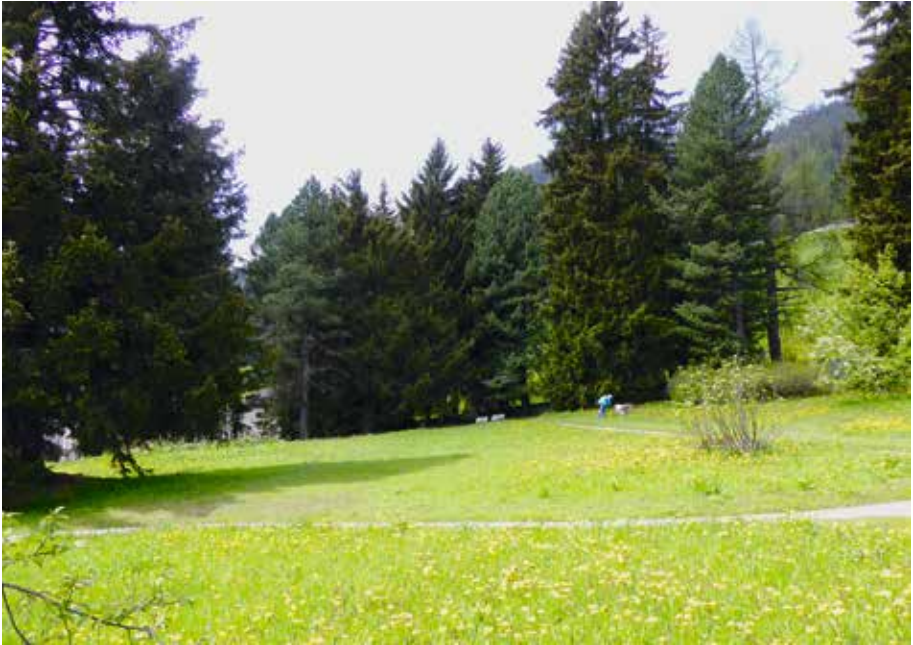
Albertipark im Frühling