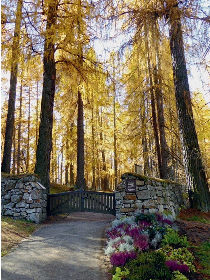
Unterer Eingang Waldfriedhof