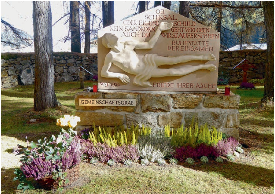
Gemeinschaftsgrab mit Herbstbepflanzung